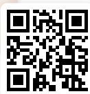
KATRIN BREEDE Verwaltung & Personal